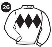
CINTO EM LOSANGO