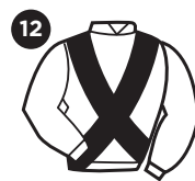
CRUZ SANTO ANDRÉ