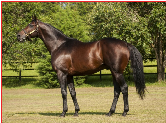
Troféu Mossoró - "Melhor 3 anos 2018/2019"

Redattore e Princesa Carina, por Know Heights